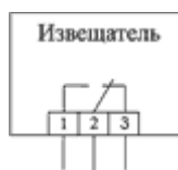
Схема подключения ИО 102-6П

Зеленый провод - общий (1). Белый провод - НЗ пара (2). Красный провод - НР пара (3).